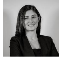
Av. Begüm Biçer İlikay